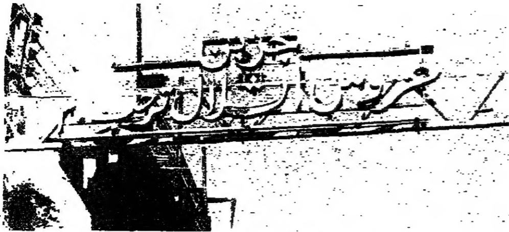
رصفه بادية .. في جباع